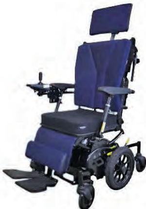
（写真4 リクライニング前）