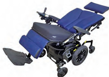
（写真5 リクライニング後）